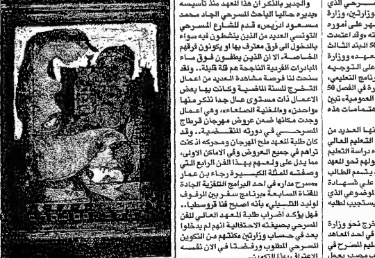
الطلاب الذين اعتصموا في ساحة المعهد العالي للفن المسرحي بتونس